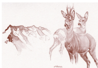
Jägersektion Falknis BKPJV

Samstag, 3. Mai 2025 08.00 - 12.00 Uhr 13.00 - 16.00 Uhr